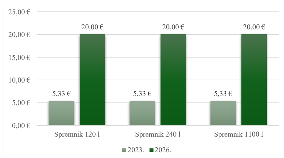
Graf 3. Usporedba cijene obvezne minimalne javne usluge (COMJU) za kategoriju korisnika koji nije kućanstvo – FIKSNI DIO

Ovi podaci i grafički prikazi jasno potvrđuju da novi model određivanja cijena uspostavlja ravnotežu između financijske održivosti pružatelja usluge i pravedne raspodjele troškova sukladno količini otpada i stvarnom korištenju usluge. Takav pristup u potpunosti je usklađen sa zakonskim zahtjevima i načelima zaštite okoliša.